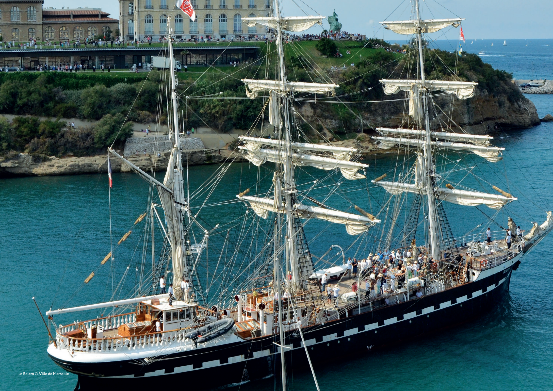
Le Belem